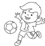
Mă joc cu mingea.